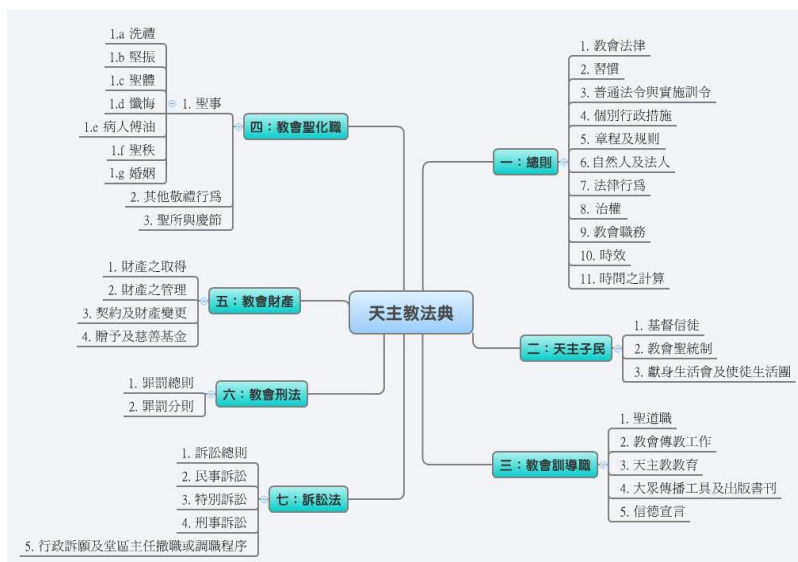
圖 1 天主教法典主要架構

台灣地區所使用的是台灣主教團於 1985 年發行該法典的拉丁文/中文對照本，此法典的編排是：法典攤平為一面，其中左頁為教會內通用的拉丁文，右頁為中文，可隨時對照。在法典後附有法條的主題索引，使用十分方便。天主教法典是採用羅馬法系的法理編排而成 14 ，以聖經為基本原理。